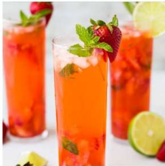
LES TESTS D'OFFRE