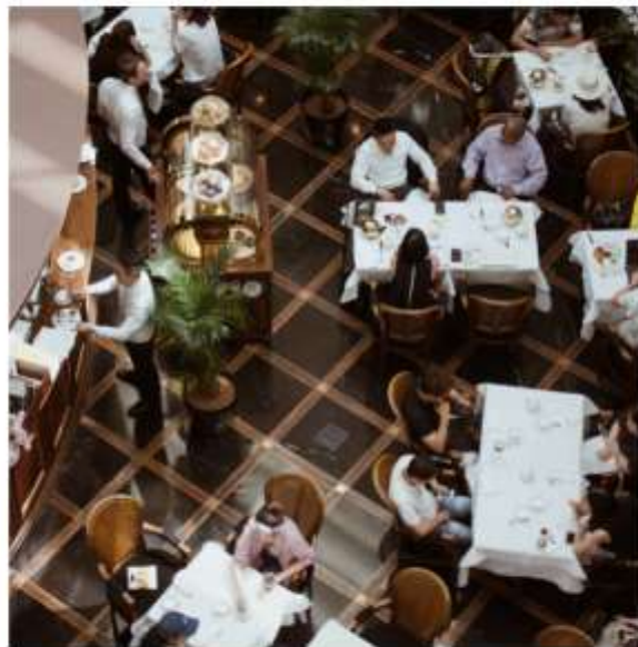
LES TESTS D'EXPERIENCE