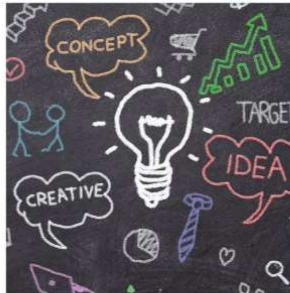
LE BRAINSTORMING AUGMENTÉ, L'AIDE A LA CONCEPTION